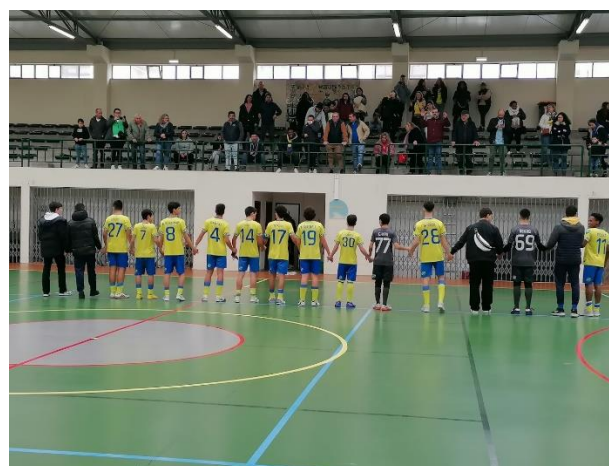
Bancada para o público