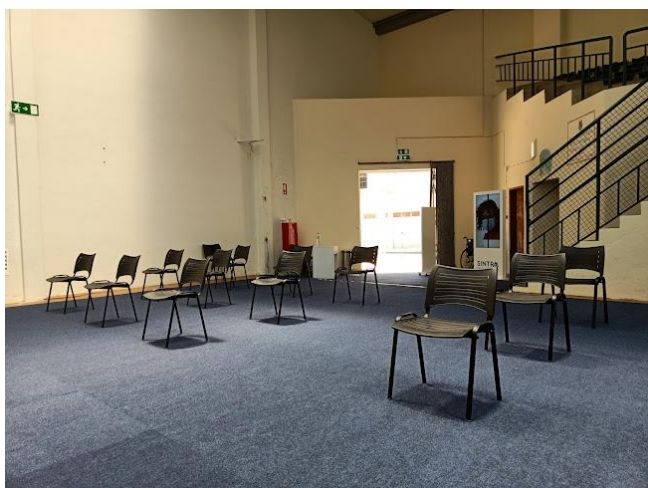
Sala de Acreditação, Sorteio, Reunião Técnica, Pesagens