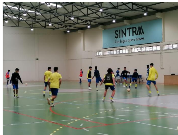
Vista Interior – Área de Jogo (FOP)